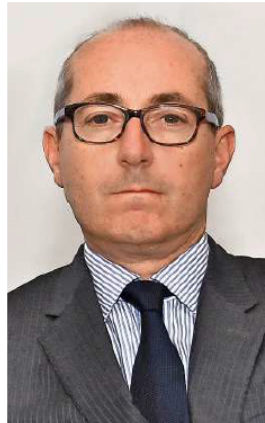
«Wenn wir heute von einer Blase sprechen, dann von einer allumfassenden.»

Zinsänderungen wirken erst mit einer gewissen Verzögerung auf die Konjunktur – und heute sind die Zinsen nach wie vor sehr niedrig. Wir wissen, dass auf lange Sicht der kritische Schwellenwert bei den zehnjährigen Zinsen bei rund 5% liegt.