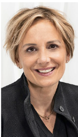
«Eine Entspannung der Lieferkettenengpässe wird unwahrscheinlicher.»