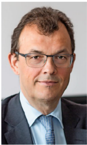
«Jeder hasst Jungfrauabahn im Moment – das finde ich gut.»

Wir glauben, dass die Angst um China übertrieben ist. Die Situation mit den faulen Krediten sollte bald geklärt sein. Es gibt dort einige positive Trends, vor allem im Gesundheitswesen und bei Konsumunternehmen dürfte es sehr gut laufen. Ein weiterer Markt, von dem nur wenige begeistert sind, ist Japan. Dort vollzieht sich ein massiver Übergang von der Veterinärwirtschaft zu einem System, in dem der Shareholder Value im Mittelpunkt steht. Die Japaner haben endlich erkannt, dass sie ihr Rentensystem nur durch einen effizienten Aktienmarkt retten können.