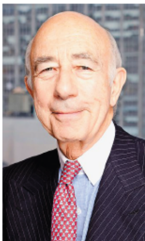
«Die Bewertungen der diesjährigen Börsengänge sind zu hoch.»

Wer sich keine Sorgen um die Schuldenquoten macht, lebt nicht in der realen Welt. Und die Verschuldung nimmt meines Erachtens weiter zu. Was ist der ein-