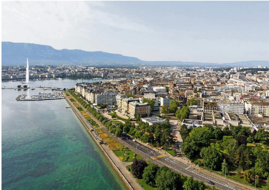
Ultravermögende Anleger in der Westschweiz halten sich bei Investitionen in Immobilien und

Bei den signifikanten Veränderungen, die in den letzten zwölf Monaten vorgenommen wurden, geben 45% der Deutschschweizer an, mehr in ihr eigenes Unternehmen investiert zu haben, vergli-